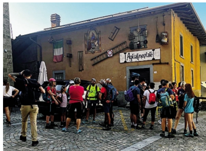
Escursionisti ieri mattina nella piazza di Vilminore, in attesa della navetta per la Diga del Gleno