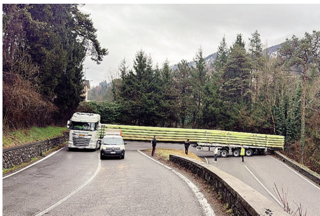
Un autoarticolato rimasto per ore in attesa di trovare il modo di uscire dalle curve della Selva

«Sicuramente il fatto di avere lavoratori della zona: un tempo erano solo di Parre, ancora oggi comunque i nostri dipendenti vengono in gran parte dalla media Val Seriana in su. C'è un alto livello di fedeltà, che comporta bassissimi livelli di turnover e assenteismo. Negli anni sono cresciuti anche i diplomati e i laureati dell'Alta Valle, che nei nostri primi anni erano pochissimi: ora ci sono ragazzi che studiano e possono mettere in campo qui la loro qualificazione. So-