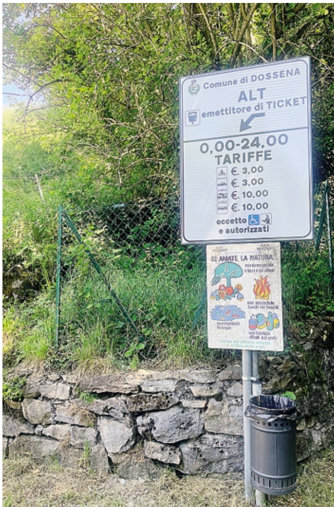
Il cartello che indica le tariffe della strada

Già attivi da tempo i ticket in altre aree della valle. Il pedaggio sulla Pizzino-Capofoppa di Taleggio è stato portato quest'anno da 2 a 3 euro. «I fondi