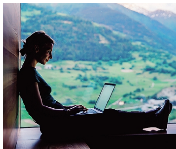
Una giovane professionista al lavoro da casa in montagna