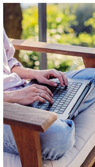
Necessarie infrastrutture stabili

Ieri mattina a Vilminore Mazzoleni, brembano pure lui (è stato anche sindaco di Taleggio dal 2004 al 2019) ed è vicepresidente regionale di Uncem oltre che nelle commissioni regionali Bilancio, Agricoltura e Montagna, è tornato sul tema illustrando un progetto di legge «che presenterò a breve sui nomadi digitali. Mi chiedo, il turismo da solo basta per dare prospettive a un territorio senza lavoro? Proviamo a sviluppare