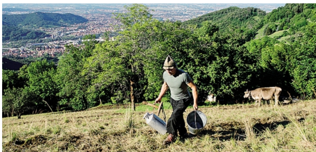
Il futuro della montagna passa anche dai giovani che si dedicano ad attività tradizionali

L'apertura del Forum, giovedì 18 giugno ad Astino, sarà dedicata al patrimonio naturale e culturale delle montagne e alle sfide poste dai cambiamenti climatici e sociali. Nella stessa giornata verrà inaugu-