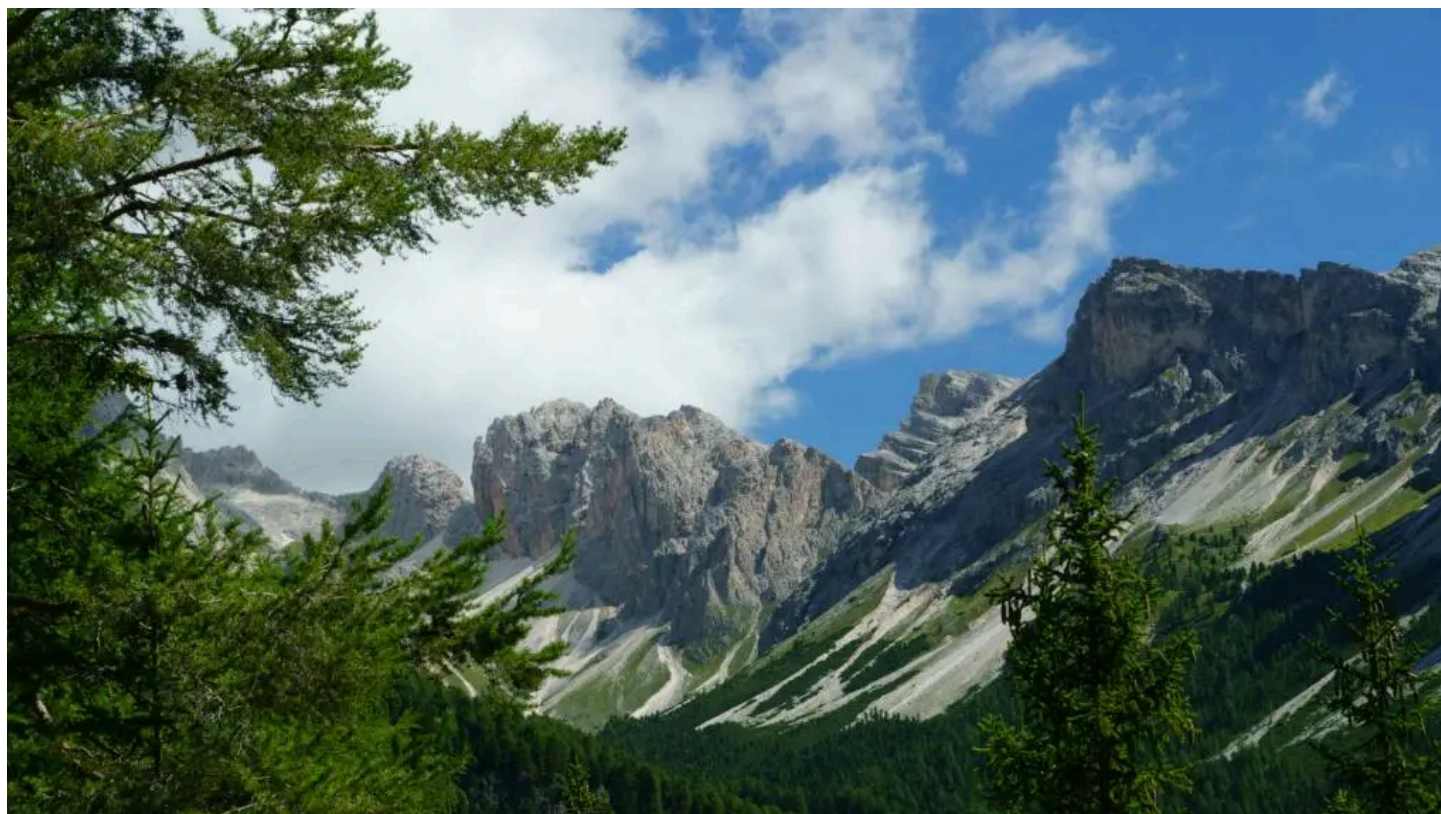
Alexander Hörl (Unsplash)

Dal 18 al 21 giugno 2026 la tappa bergamasca della manifestazione, promossa per la sede bergamasca da OrobieLab dell’Università degli studi di Bergamo, attraverserà Astino, la Valle Brembana, la Valle Seriana e la Valle di Scalve