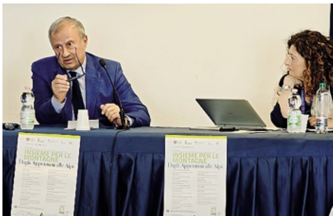
Un momento della tappa organizzata a Termoli

rato un accordo di cooperazione tra l'Università di Bergamo e la Moshi Co-operative University della Tanzania, con il coinvolgimento del Kilimanjaro National Park. L'iniziativa intende rafforzare il dialogo internazionale tra le Orobie e altri contesti montani del mondo, dalla Lombardia all'Africa orientale.