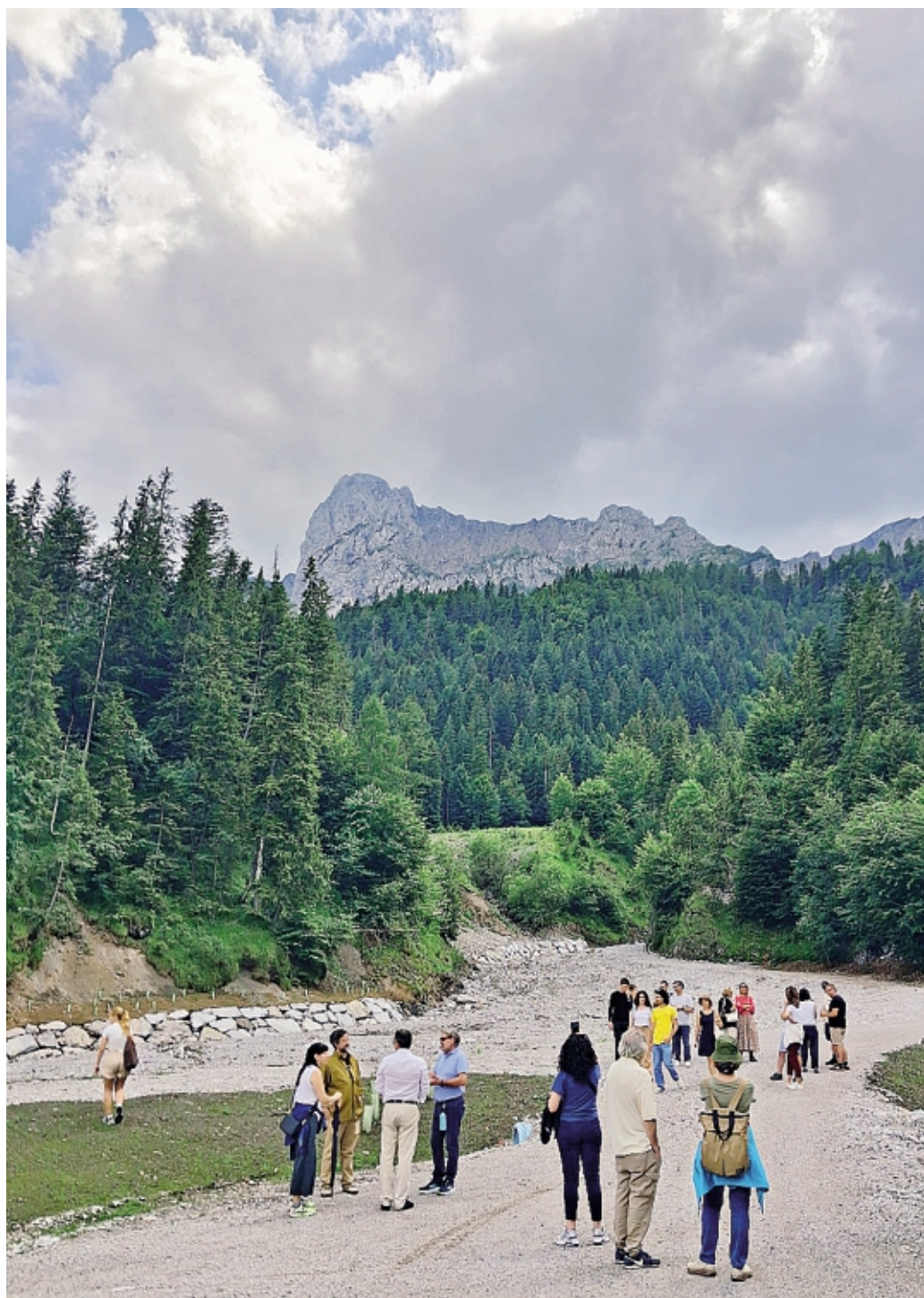
Il sopralluogo a Valcanale