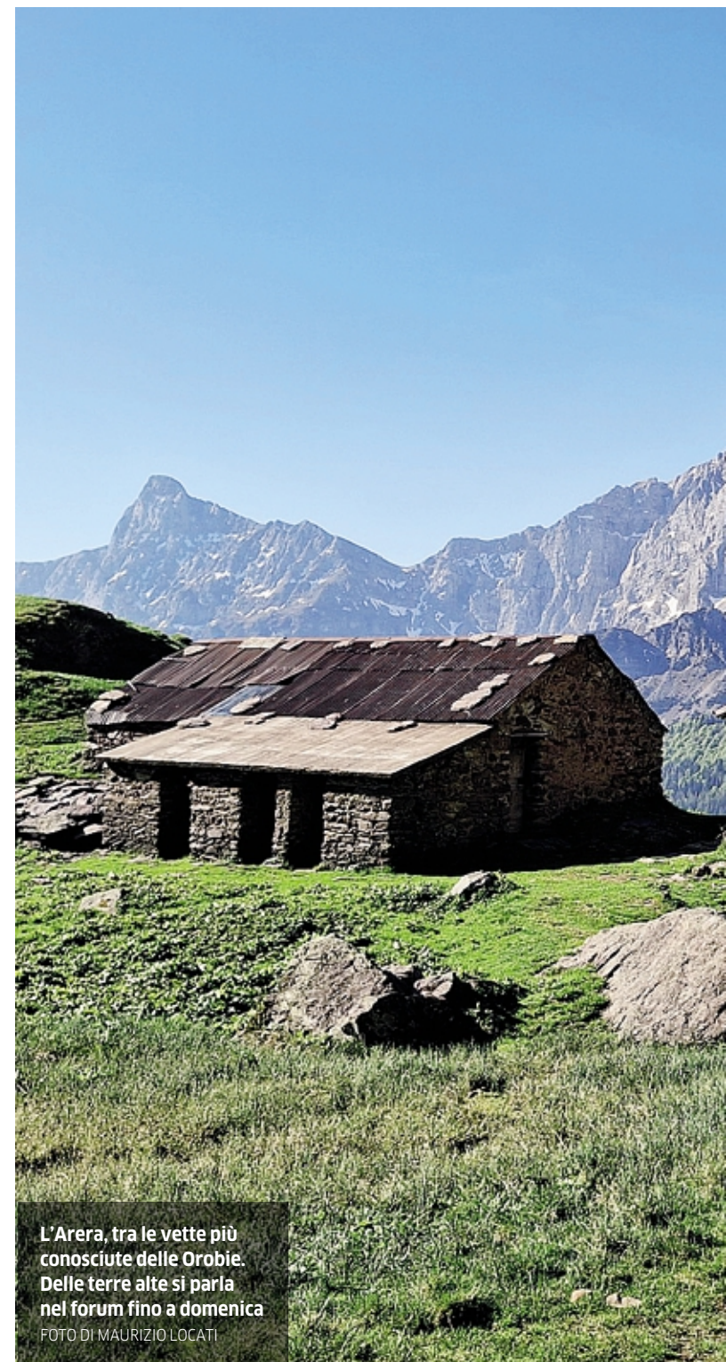
L'Arera, tra le vette più conosciute delle Orobie. Delle terre alte si parla nel forum fino a domenica

Alla giornata di convegno ieri hanno portato il loro contributo anche le istituzioni. «La scelta di ospitare questo evento ad Astino non è casua-