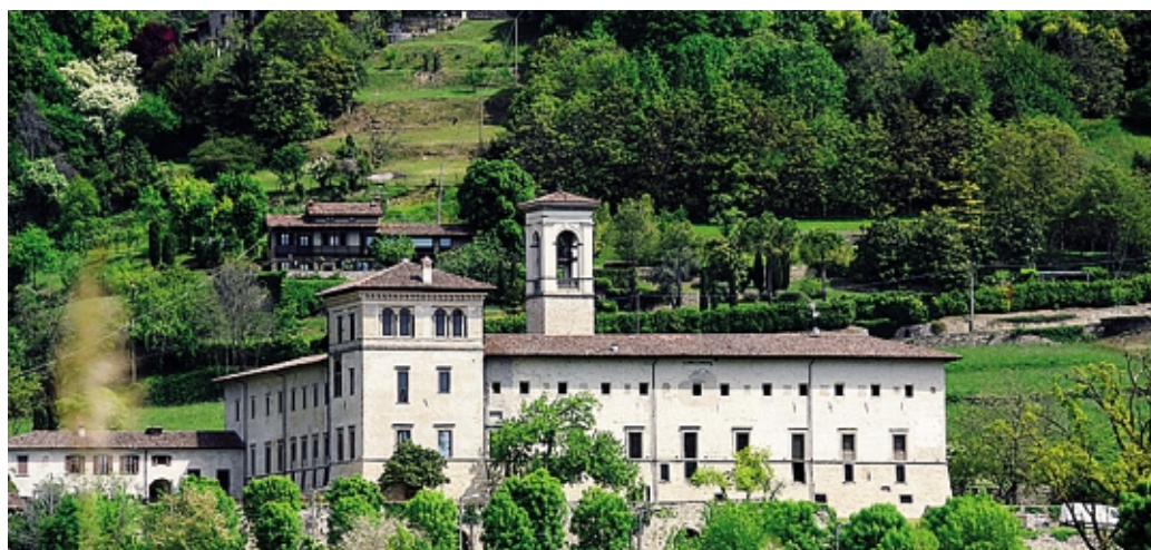
La prima giornata del forum si terrà al complesso di Astino