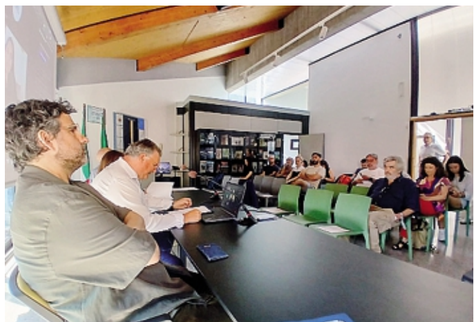
Un momento del forum, ieri in Valle Brembana