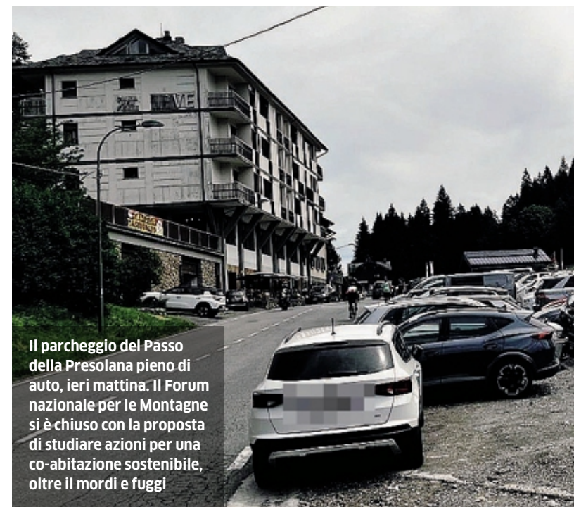
Il parcheggio del Passo della Presolana pieno di auto, ieri mattina. Il Forum nazionale per le Montagne si è chiuso con la proposta di studiare azioni per una co-abitazione sostenibile, oltre il mordi e fuggi