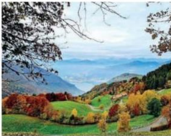
Tra lago e montagna. Pisogne vuole crescere con l'aiuto di tutti

Università di Bergamo e Comune al lavoro per raccogliere idee utili a «rigenerare il territorio»