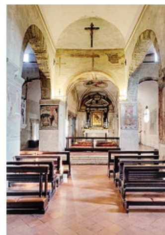
L'interno della Pieve