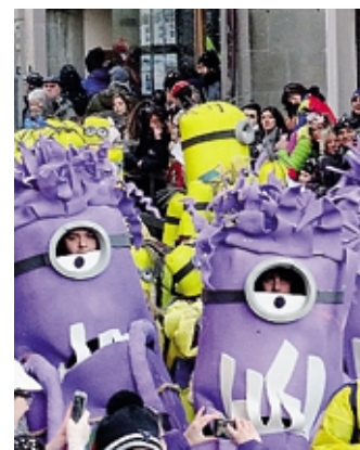
Una sfilata di carnevale

Il weekend successivo, in occasione del carnevale ambrosiano, da non perdere la caccia al