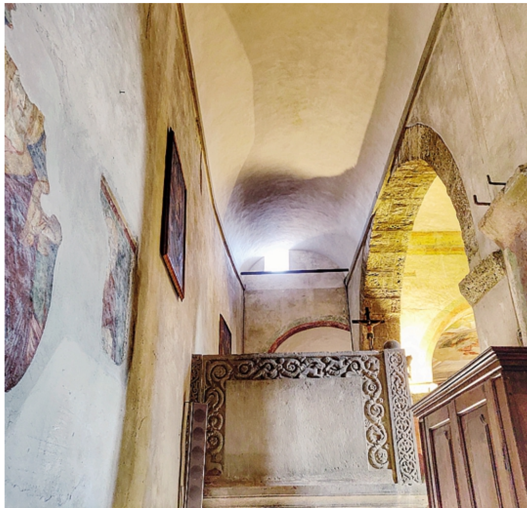
Uno scorcio dell'interno, dove i lavori sono stati completati nei mesi scorsi