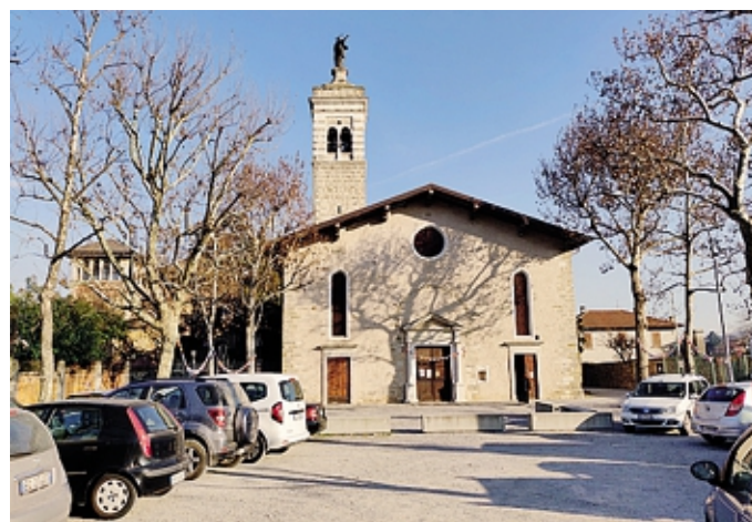
L'esterno del complesso della Madonna del Castello